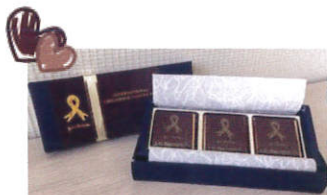
個数限定：チョコレート（6個入り） ※在庫がなくなり次第終了いたします。

募金は国内での小児がんの療養環境の向上と、CCIを通じて発展途上国の小児がん医療の向上に役立てられます。この国際小児がんデーキャンペーンの期間中に 500円以上の募金 をしていただいた方に、チャリティーチョコレート（個数限定）、ゴールドリボンピンバッジ、ストラップ、エコバックをご用意しています。